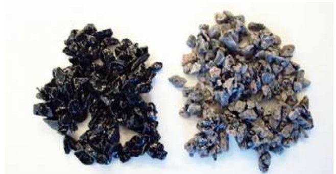
MED Vidhäftningsaktivt filler